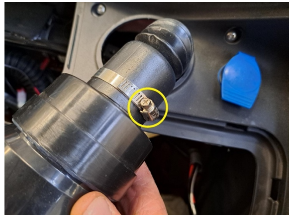
Löysää tuuletinritilässä kiinni olevan ilmaputken kiristintä. (ristipäämeisseli ph2).