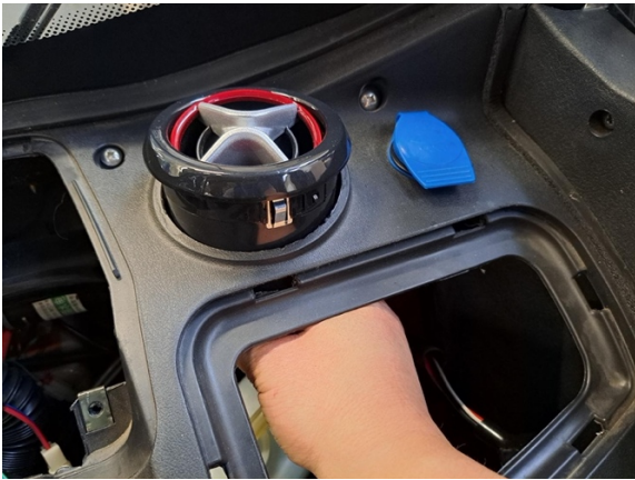
Työnnä tuuletusritilä pois paikoiltaan.