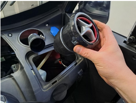
Ota tuuletusritilä irti ilmaputkesta.

Uuden osan asennus käänteisessä järjestyksessä.